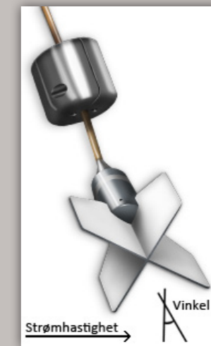
Figur 1: Instrumentets virkemåte

Instrumentets elektronikk er montert på et sirkulært sensor-kort som først og fremst inneholder en toakset vinkelmåler og en dataprosessor. Vinkelsignalene sendes til prosessoren som fortløpende beregner vinkel \theta uavhengig av hellingens retning. Deretter styrer prosessoren ut en 4–20 mA strøm-sløyfegenerator og en 9600 baud RS-232-generator. RS-232-generatoren presenterer hellingsvinkelen \theta på ASCII format med oppdateringsfrekvens på ca. 1 sekund.